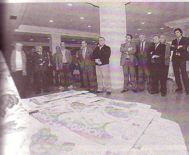
NTACIÓN. El acto celebrado en Noreña.

La verdad que el broche final del mandatario no deja que tras-pase ni una gota de sebo: «Claro, que igual resulta que la diferencia estriba en que Cataluña los huevos son rojos, y en Valencia son azules...puede ser...en Pola de Siero, capital de asturia los huevos son pintos», afirma el regidor. Corrales, genio y figura, pero noble.